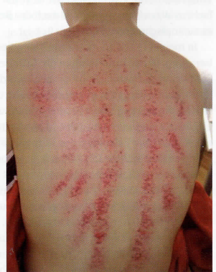
Abb. 1 Sha tritt an den behandelten Hautstellen an die Oberfläche.

Eine 29-jährige Frau suchte meine Sprechstunde auf, nachdem sie morgens mit Schmerzen und Bewegungseinschränkung, besonders bei Rechtsdrehung, wach geworden war. Sie berichtete, bei offenem Fenster, vermutlich im Durchzug, geschlafen zu haben. Im Anamnesegespräch gab sie an, beruflich und privat sehr unter Stress zu leiden. Bei der körperlichen Untersuchung zeigte sich eine blasse Zunge mit geröteten Rändern und fettig-weißem Belag , der Puls war eher schwach und oberflächlich , gespannt in der Leber-Position. Der Drucktest (▶ S. 39 ) sprach für das Vorhandensein von Sha.