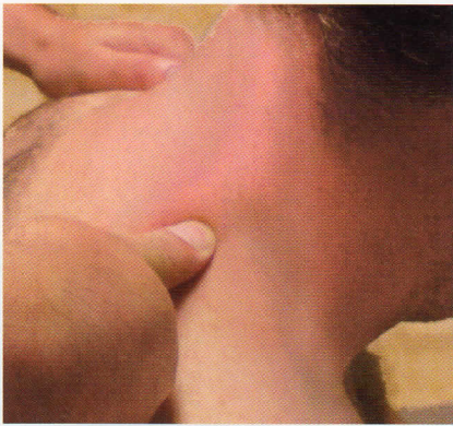
Abb. 2 Schmerzhafteste Punkte werden auf Sha untersucht.