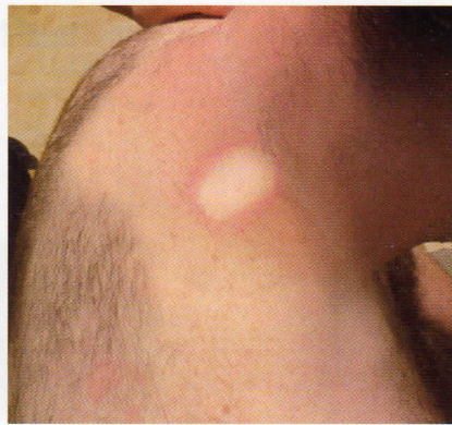
Abb. 3 Ein Hinweis auf Sha: Das Blut kehrt nach dem Loslassen nur langsam in die palpierende Stelle zurück.